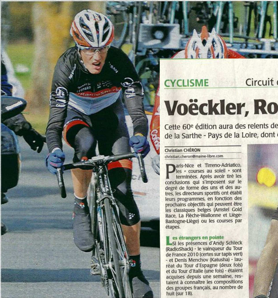
Paris-Nice 2012. Andy Schleck (à gauche) n'aura effectué qu'une trop

De Saint-Gilles-Croix-de-Vie (mardi 3 avril) à Sablé (vendredi 6 avril), Andy Schleck bénéficiera d'une garde rapprochée de qualité. Outre le Danois Jakob Fuglsang, trois fois lauréat du